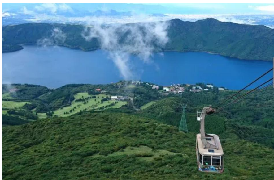
駒ヶ岳ロープウェイ