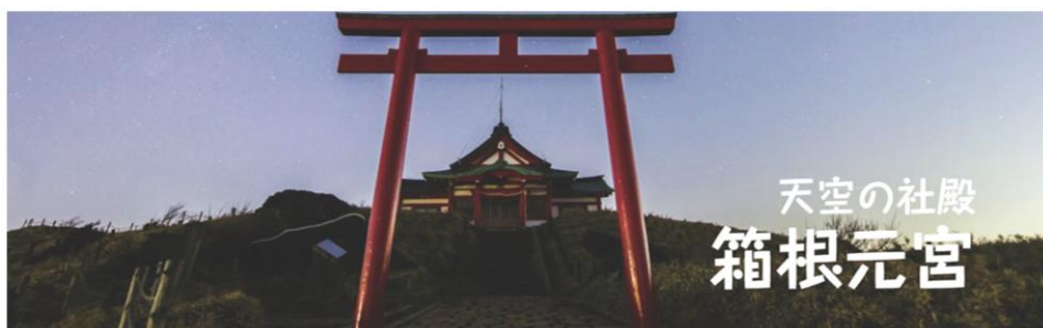
天空の社殿 箱根元宮