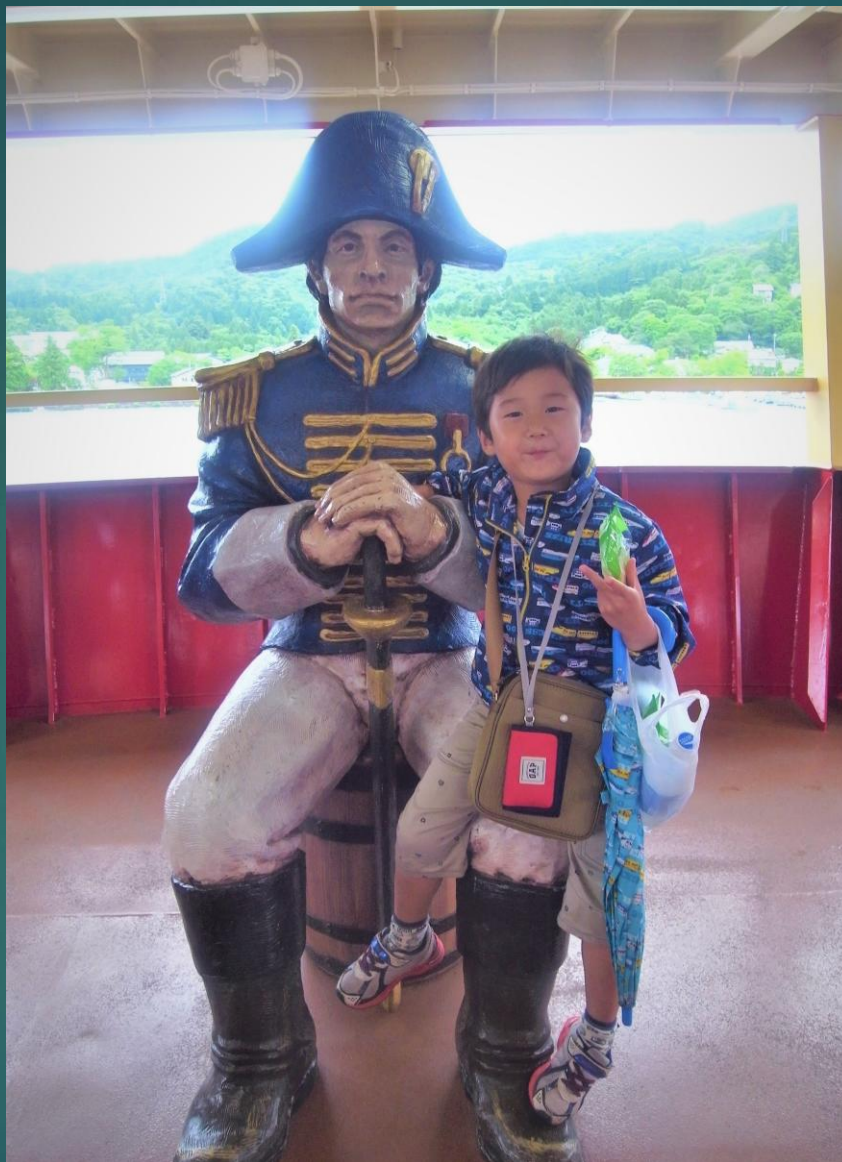
船内の海賊と記念撮影