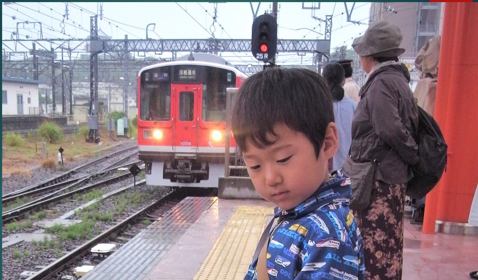
小田原で箱根湯本行きの電車が到着