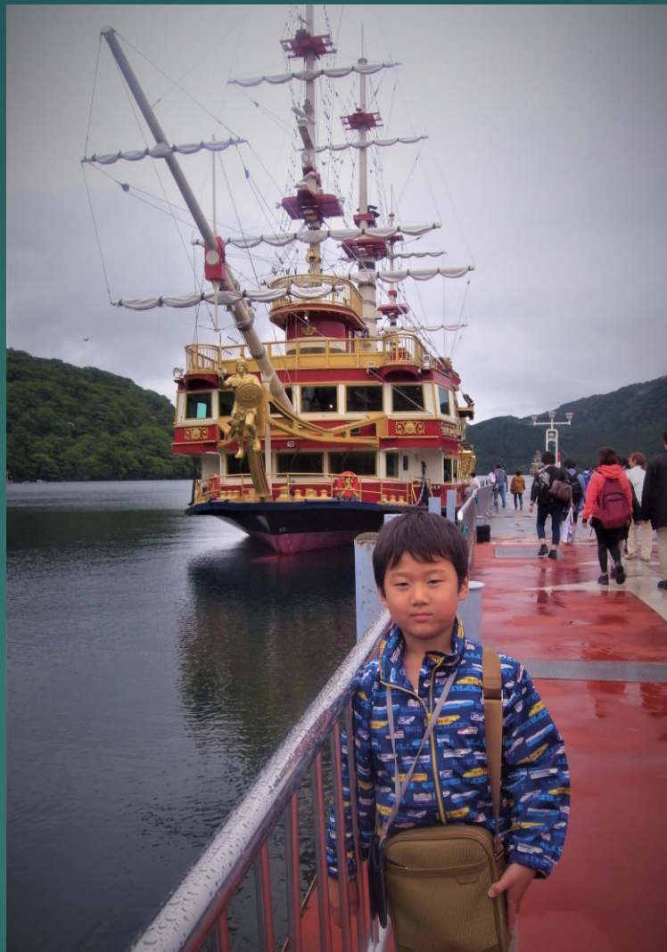
海賊船 桃源台～箱根町～ 元箱根