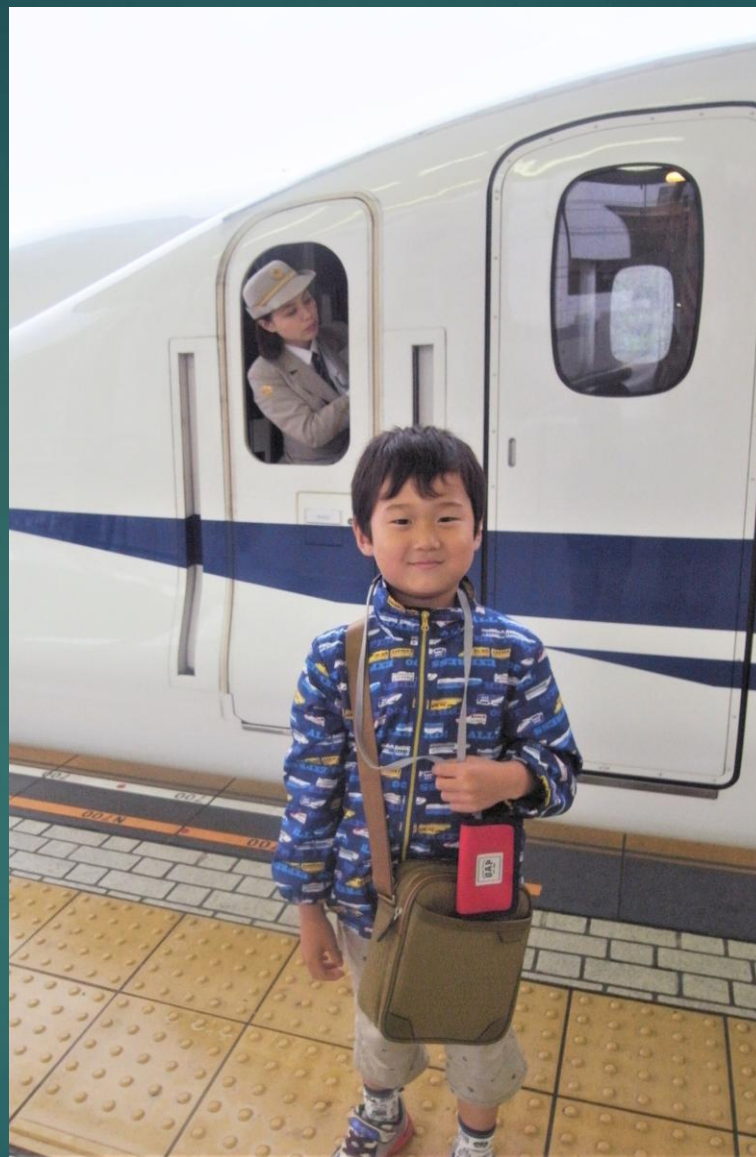
新横浜～小田原 新幹線 女性の新幹線の車掌さんが頑張っていました。