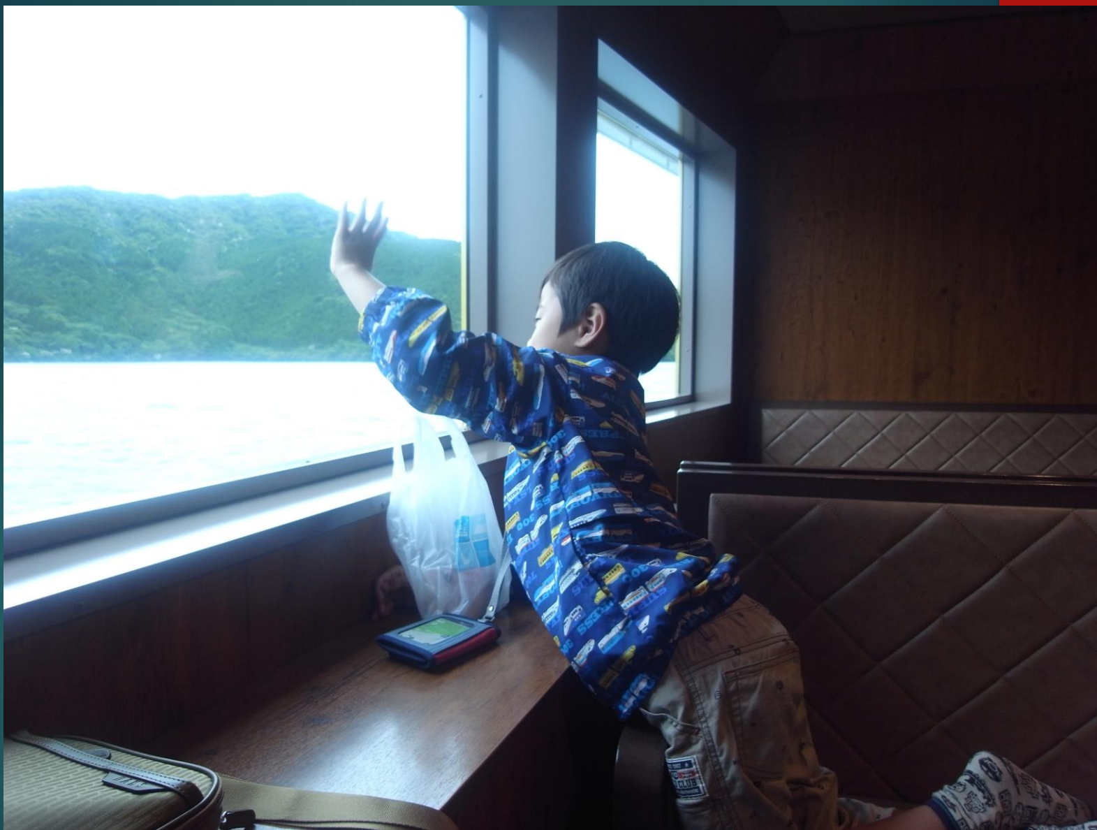
海賊船の船内、窓の向こうは箱根駒ヶ岳